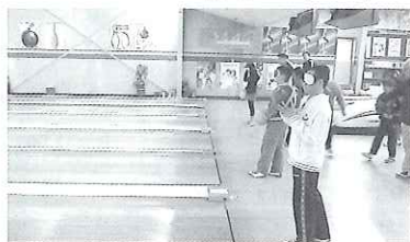
▲アイマスクを付けての投球も体験

この大会は、福祉への関心と理解を深めるという目的も含 まれており、ゲーム中、2投はアイマスクを付けてもらうと いうルールで行われました。 対象地域の小学校から21名 の参加があり、ゲーム中はス トライクやスペアに拍手が沸 きあがり、楽しい交流会とな りました。