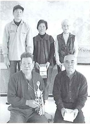
▲優勝した四葉会の皆さん

平成23年12月3日(土)有家堂崎公民館で「災害救援ボランティアセンター研修」を行いました。東日本大震災で更にボランティアの重要性が目目される中、南島原市社会福祉協議会でも、災害時のボランティアの受入体制を整備するための取り組みをしています。今後も研修を重ねながら充実した体制づくりを目指します。