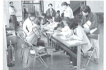
▲「ボランティア受付」での対応をシミュレーション中

平成23年12月3日(土)有家堂崎公民館で「災害救援ボランティアセンター研修」を行いました。東日本大震災で更にボランティアの重要性が目目される中、南島原市社会福祉協議会でも、災害時のボランティアの受入体制を整備するための取り組みをしています。今後も研修を重ねながら充実した体制づくりを目指します。