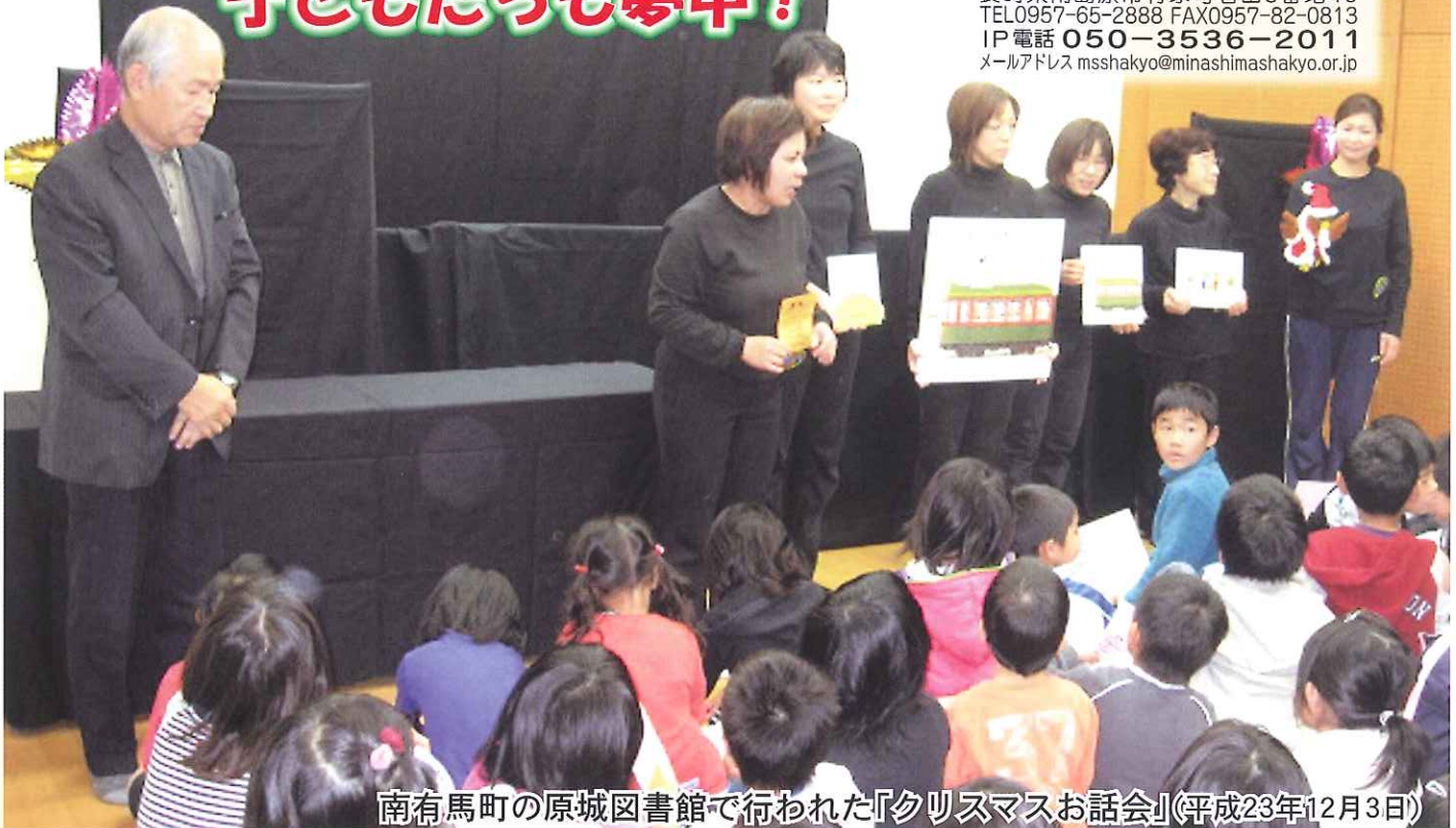
南有馬町の原城図書館で行われた『クリスマスお話し会』(平成23年12月3日)