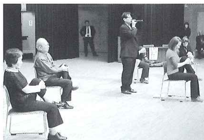
▲理学療法士による運動指導