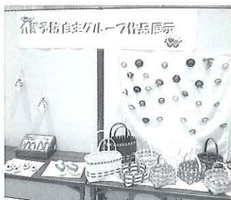
▲各グループからの作品を展示