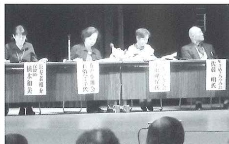
▲各グループからの活動発表