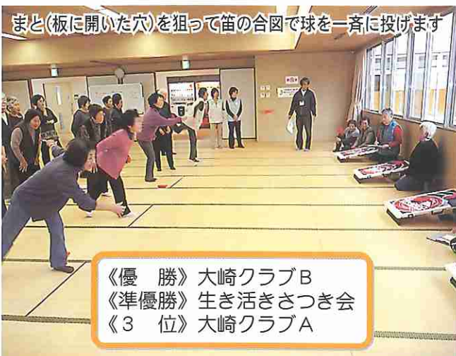
まど(板に開いた穴)を狙って笛の合図で球を一齐に投げます

私たちの活動は加津佐での高齢者の自主グループ「はつらつ会」を主として、行政が行っている教室「わこなる会」などへの手助け、口之津での自主グループ「たんぽぽ会」などにも時々顔を出しています。自主グループの参加者は私たちに近い年齢の方も多いので同じ感覚で楽しむようにしています。よく言われる「ピンピンコロリ」ではないですが、寝込まないで毎日を送れるように、そして少しでも皆様のお役に立てたらと思いい、時間の許す限りボランティアを続けていこうと会員みんな頑張っています。