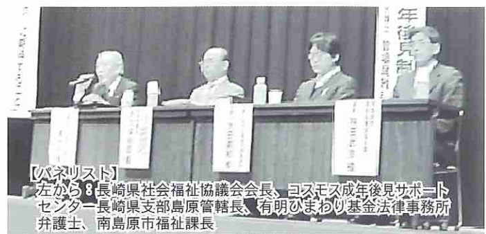
【パネリスト】 左から：長崎県社会福祉協議会会長、ユズモス成年後見サポートセンター長、長崎県支部島原管轄長、有明ひまわり基金法律事務所弁護士、南島原市福祉課長