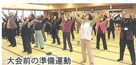
大会前の準備運動

この事業は、一次介護予防事業を終了した、布津町内の自主グループを対象に、交流及び活性化を目的として開催しました。準備運動のあと試合が始まり、全10チーム(約40名の参加者は、日頃の練習の成果を発揮し、和気あいあいとした中、無事終了することが出来ました。