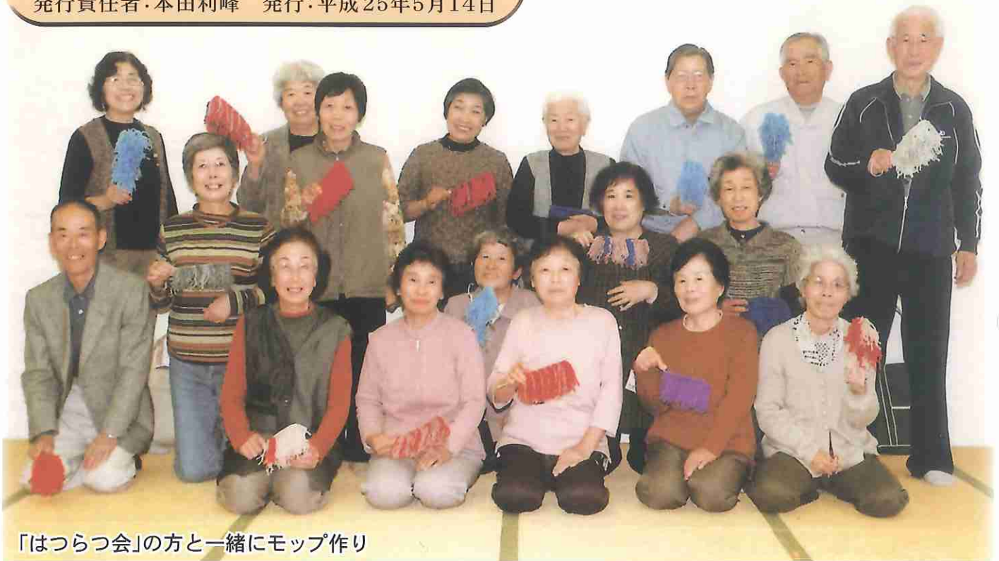
「はつらつ会」の方と一緒にモップ作り

〒859-2121 長崎県南島原市有家町石田8番地46 TEL0957-65-2888 FAX0957-82-0813 IP電話 050-3536-2011 メールアドレス msshakyo@minashimashakyo.or.jp