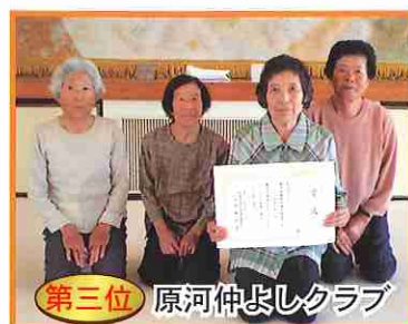
第三位 原河仲よしクラブ