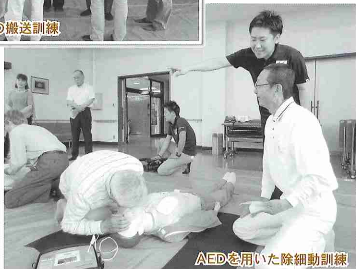
AEDを用いた除細動訓練

有家地区民生委員児童委員協議会では、6月3日(月)の定例会で一次救命処置・傷病者を安全に運ぶ搬送方法の研修を行いました。「身近な人の命を守るために」を目的に、日本赤十字社長崎支部の方から指導を受けました。民生委員全員真剣に、心肺蘇生・AEDを用いた除細動・気道異物除去方法・搬送の基本・応急担架の作り方等を実際に学んで、今後、家族・地域の人「もしもの時」に対応できるよう、定期的に研修を続けていきたいと思えます。