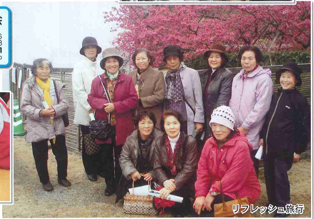
リフレッシュ旅行