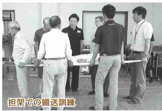
担架での搬送訓練