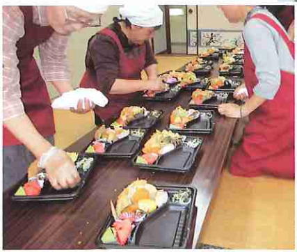
▲ 独居高齢者に弁当作り

〒859-2121 長崎県南島原市有家町石田8番地46 TEL0957-65-2888 FAX0957-82-0813 IP電話 050-3536-2011 メールアドレス msshakyo@minashimashakyo.or.jp