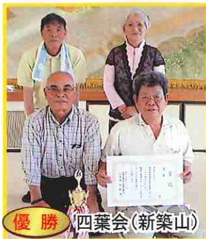
優勝 四葉会(新築山)