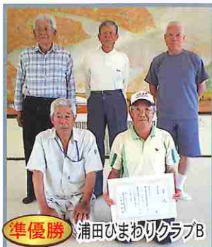
準優勝 浦田ひまわりクラブ

南有馬地区自主グループ対抗バッグー大会が6月1日に原城文化センターにおいて開催されました。当日は13チーム58名の参加があり、熱戦が繰り広げられました。