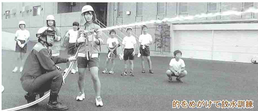
的をめがけて放水訓練