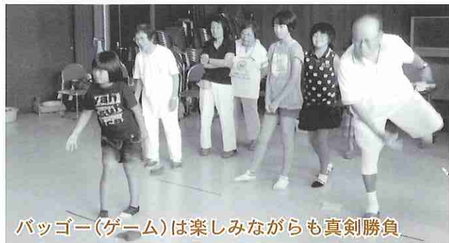
バグー(ゲーム)は楽しみながらも真剣勝負