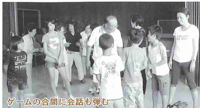
ゲームの合間に会話も弾む

最初お互いの自己紹介から始まり、バグーのルール説明をして競技開始。終始、拍手と笑いが絶えない楽しいひと時を過ごしました。そして、大崎クラブの方々が、子どもたちにお土産まで用意してくださり心温まる交流となりました。