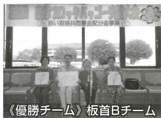
《優勝チーム》板首Bチーム