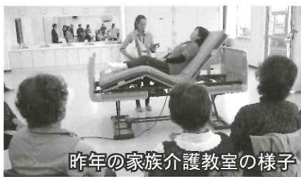
昨年の家族介護教室の様子

高齢者を自宅で介護されている方・介護の方法を勉強してみたい方を対象に、島原地域広域圏組合の委託を受けて「家族介護教室」を開催します。参加費は無料ですので、お気軽にご参加下さい。