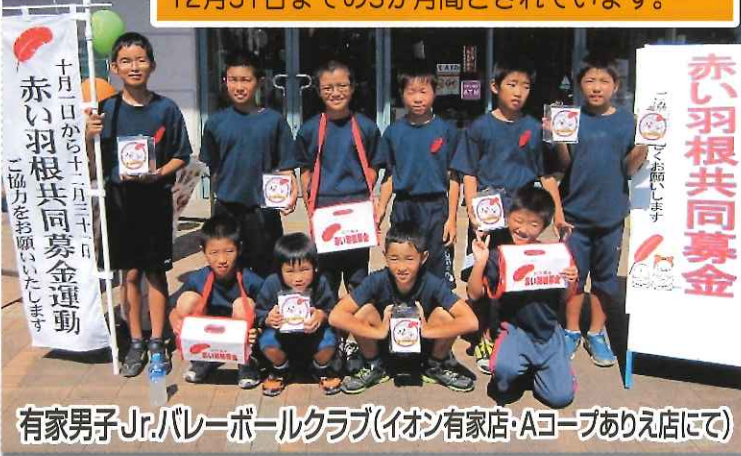
有家男子Jr.バレーボールクラブ(イオン有家店・Aコープありえ店にて)

赤い羽根共同募金は社会福祉法112条～124条に定められた募金です。 厚生労働大臣の告示により、毎年10月1日から12月31日までの3か月間とされています。