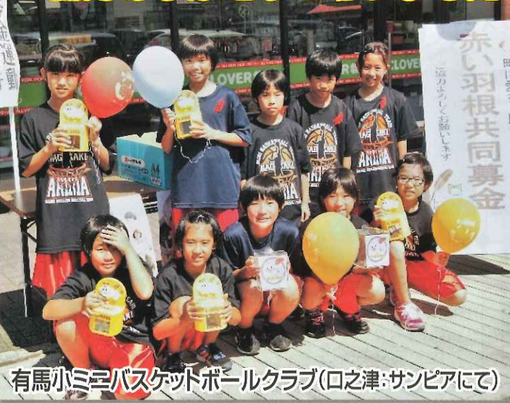
有馬小ミニバスケットボールクラブ(口之津:サンピアにて)