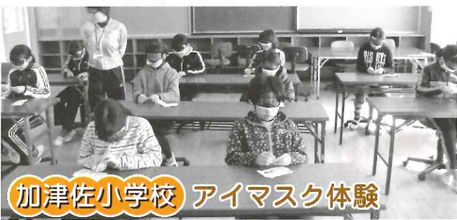
加津佐小学校 アイマスク体験