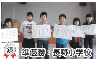
銀 準優勝：長野小学校