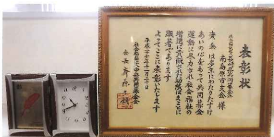
▲受賞した記念品(置時計)と表彰状