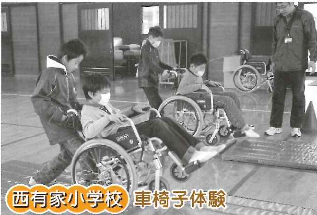
西有家小学校 車椅子体験

平成27年度南島原市社協 有家支所の地域還元事業とし て、1月16日(土)に有家コレ ジヨホールにてゆかいなコン サートを開催しました。 園児や児童を対象に約50 0人の参加がありました。歌 のお姉さんによる楽しい歌遊 びや、マジカルパフォーマー による不思議なマジックショ ーなど、1時間盛り沢山の内 容で子ども達は終始楽しんで いました。