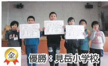
金 優勝：見岳小学校

〒859-2121 長崎県南島原市有家町石田8番地46 TEL0957-65-2888 FAX0957-82-0813 IP電話 050-3536-2011 メールアドレス msshakyo@minashimashakyo.or.jp