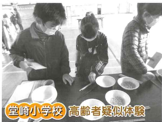
堂崎小学校 高齢者疑似体験

市内の小学校4カ所で高齢者 疑似体験・車椅子体験・アイマ スク体験を行いました。 高齢者疑似体験では体験セッ トを装着して豆つかみや階段の 登り下りを体験、車椅子体験で は車椅子の使い方を学んだ後、 坂道・段差・悪路を体験、アイ マスク体験ではアイマスクをつ けて4種類のコインを触り、金 額が小さい順に並べる体験等 をしました。 今回の体験を通して、高齢者 や障害を持った方を見かけた時 にどのようなお手伝いをすれば いいか・障害があっても出来る ことがたくさんあることを学ん だようです。