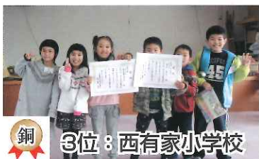
銅 3位：西有家小学校