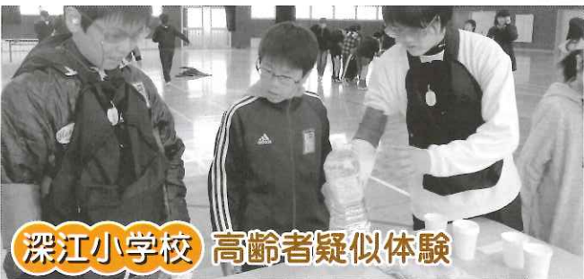
深江小学校 高齢者疑似体験

市内の小学校4カ所で高齢者 疑似体験・車椅子体験・アイマ スク体験を行いました。 高齢者疑似体験では体験セッ トを装着して豆つかみや階段の 登り下りを体験、車椅子体験で は車椅子の使い方を学んだ後、 坂道・段差・悪路を体験、アイ マスク体験ではアイマスクをつ けて4種類のコインを触り、金 額が小さい順に並べる体験等 をしました。 今回の体験を通して、高齢者 や障害を持った方を見かけた時 にどのようなお手伝いをすれば いいか・障害があっても出来る ことがたくさんあることを学ん だようです。