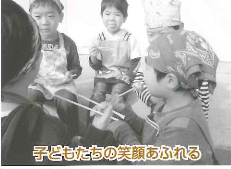
子どもたちの笑顔あふれる