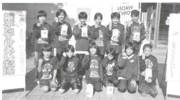
【12月3日 街頭募金を実施しました。】