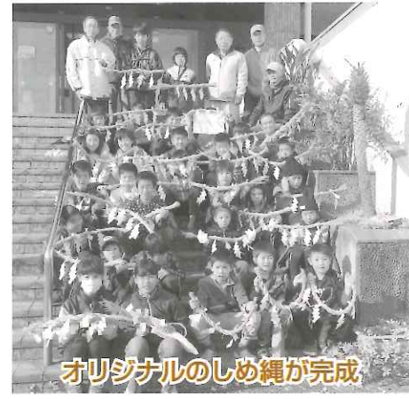
オリジナルのしめ縄が完成

子供たちは、一つ一つ真剣な表情で話や手の動かし方などを教えていました。わらを編み込む作業では、親子で協力し、新年の無病息災の想いを込めた、しめ縄が作られました。