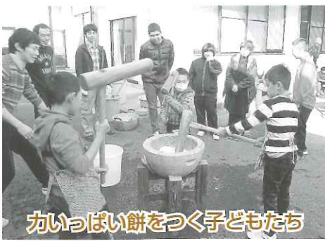
力いっぱい餅をつく子どもたち

しめ縄作りでは、地域の老人会や神社関係者の皆さまからご指導をいただき、わらを叩き柔らかくする作業から、一緒に行いました。