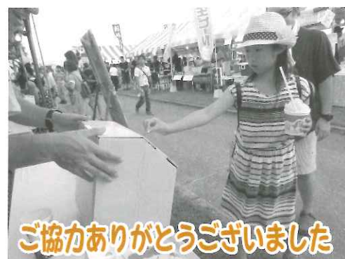
ご協力ありがとうございました