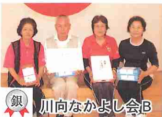
銀 川向なかよし会B

6月3日、第7回南有馬地区自主グループ対抗バッゴ大会が南有馬武道館で開かれました。今回は15チーム合計65名の参加でした。