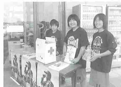
有馬小学校ミニバスケットボール部 北有馬中学校女子バスケットボール部の子どもたち

毎年5月は日本赤十字社強化月間として、今年も5月10日(土)に有家ツインプラザ(イオン有家・Aコープありえ)にて日赤街頭募金を行いました。募金活動には、有馬小学校ミニバスケットボール部・北有馬中学校女子バスケットボール部の子どもたちが協力をし、たくさんの募金を皆様からいただくことができました。活動中は、子どもたちの元気な声が響き渡っていました。皆さまからいただいた募金は、国際活動や血液事業などに大切に活用させていただきます。ご協力ありがとうございました。