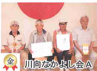
金 川向なかよし会A

6月3日、第7回南有馬地区自主グループ対抗バッゴ大会が南有馬武道館で開かれました。今回は15チーム合計65名の参加でした。