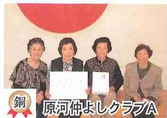
銅 原河仲よしクラブA