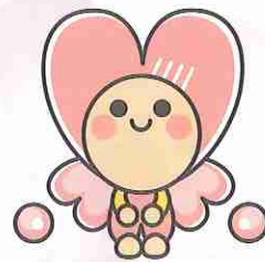
長崎県内社会福祉協議会 マスコットキャラクター いこいちちゃん