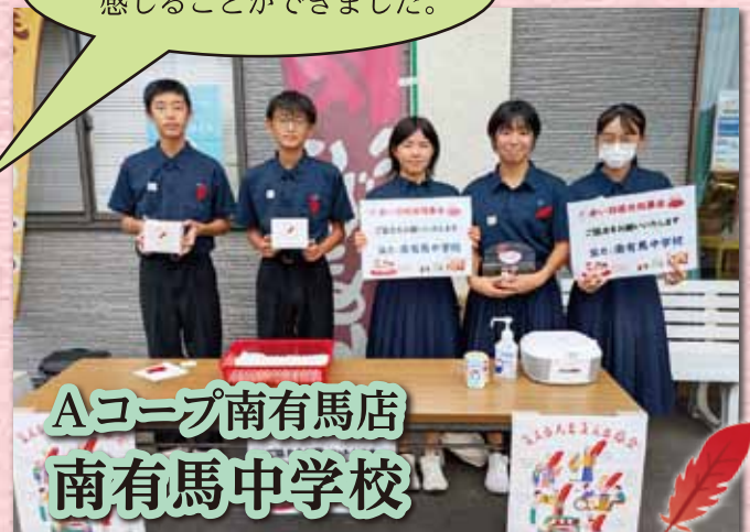
Aコープ南有馬店 南有馬中学校