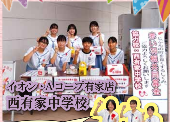
イオン・Aコープ有家店 西有家中学校