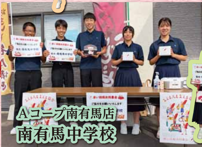
Aコープ南有馬店 南有馬中学校