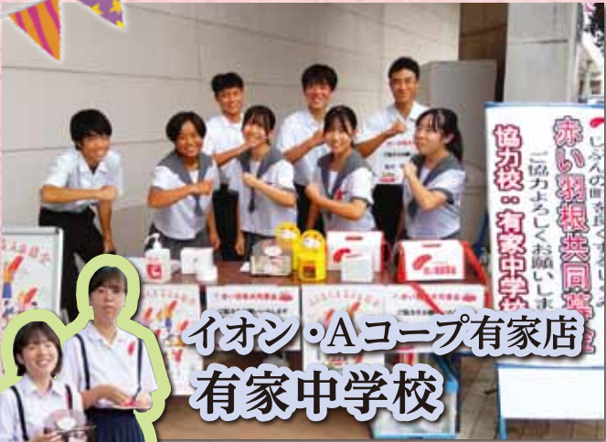
イオン・Aコープ有家店 有家中学校