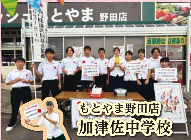
もとやま野田店 加津佐中学校