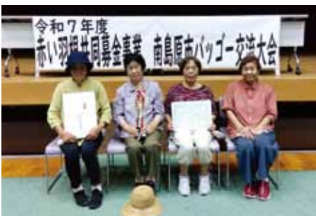
▲優勝：寺田寄ろう会

9月30日(火)に南島原市バグゴ交流大会を開催しました。各町予選大会を勝ち抜いたグループが集まり、全24チームが参加しました。合計96名の競技者が優勝を目指して熱戦を繰り広げました。