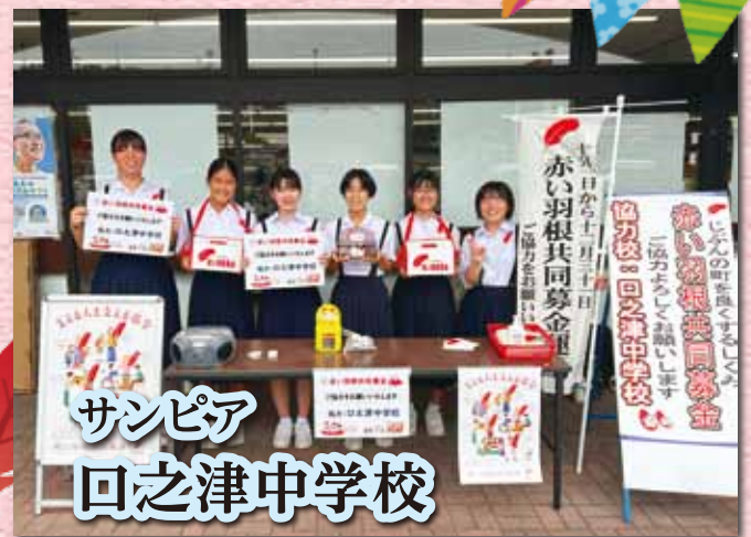
サンピア 回之津中学校