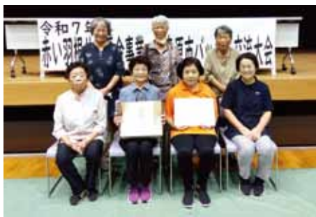
▲準優勝：東池田生き生き月よう会