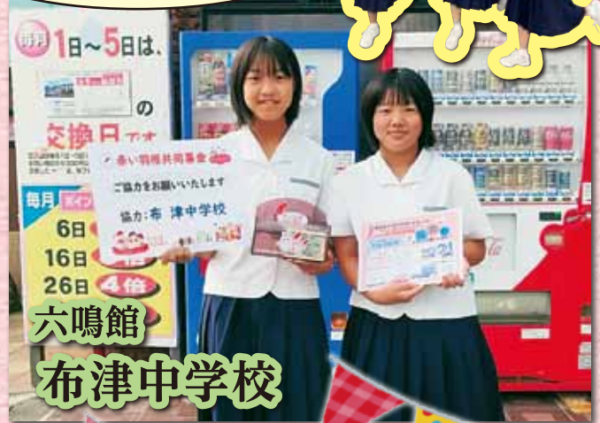
六鳴館 布津中学校