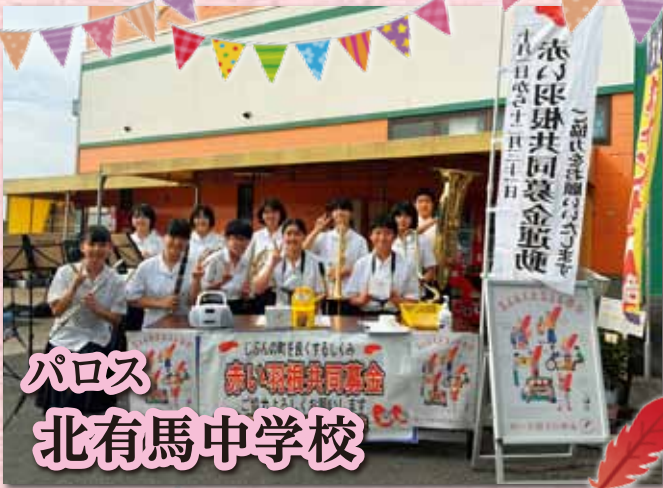
パロス 北有馬中学校