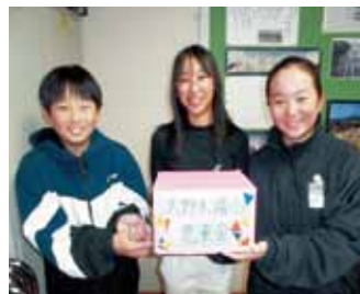
・大野木場小学校 様