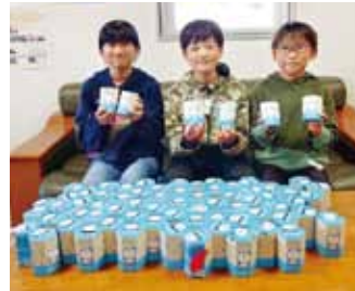
・口之津小学校 様