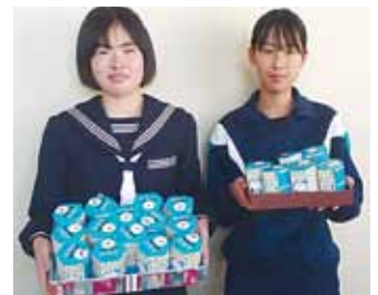
・西有家中学校 様