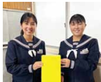
・北有馬中学校 様