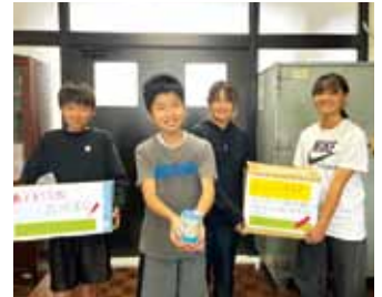
・南有馬小学校 様