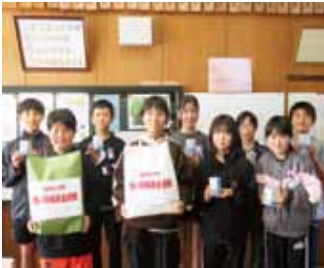
・加津佐小学校 様