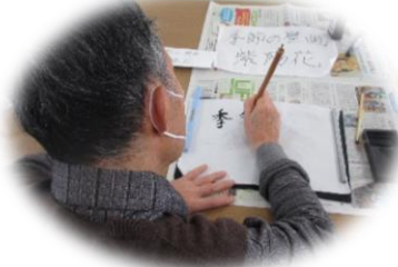
習字を書かれています