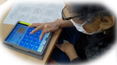
タブレットで脳トレ中