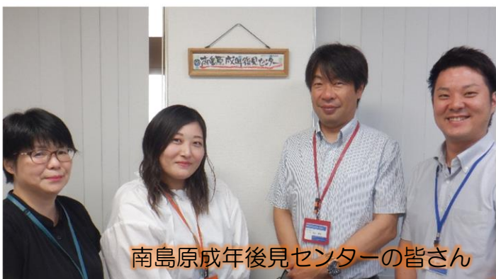
南島原成年後見センターの皆さん