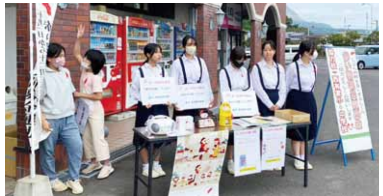
西有家ショッピングセンター クレア《協力校：西有家中学校 12名/西有家小学校 2名》