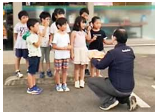
《ファミリーマート加津佐店》