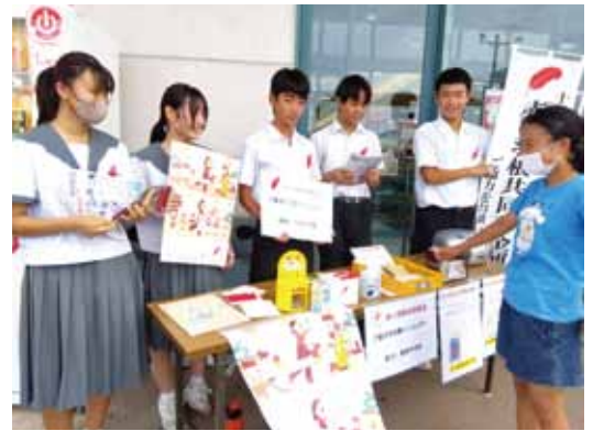
有家ツインプラザ(Aコープ・イオン)《協力校：有家中学校 15名》